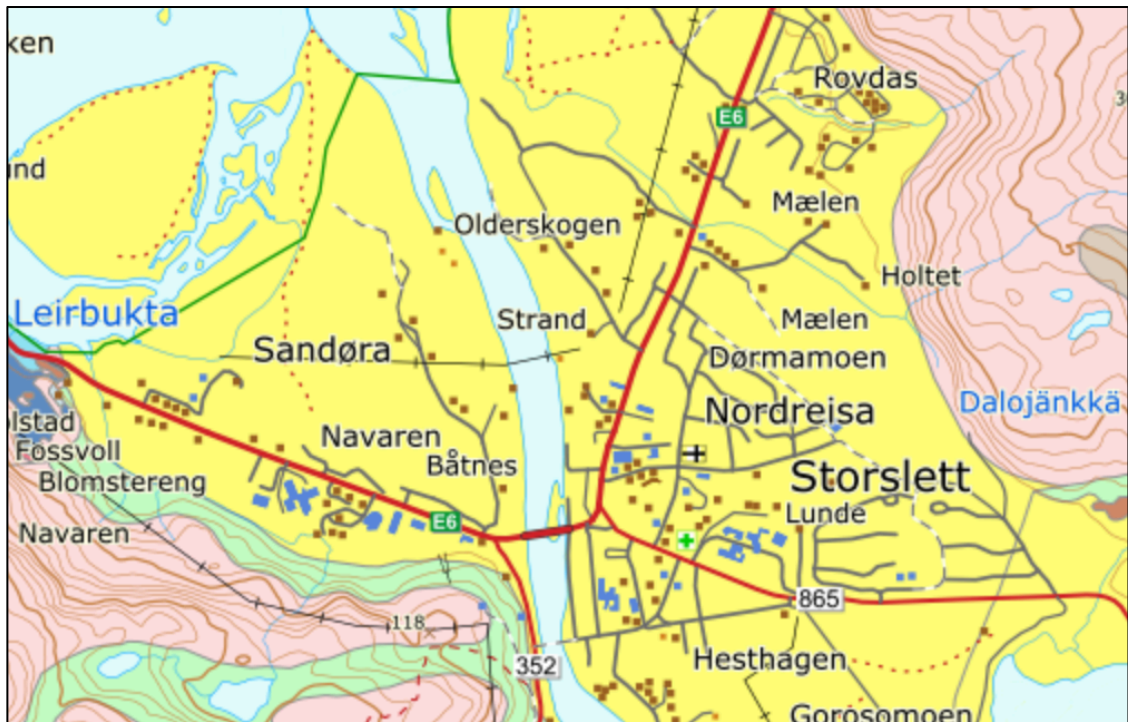
Figur 4.1. Kart som viser forekomst av løsmasser i Storslettområdet. Gul farge viser sedimenter av fluvial opprinnelse (elvedeltater). Grønn farge er morenemateriale.