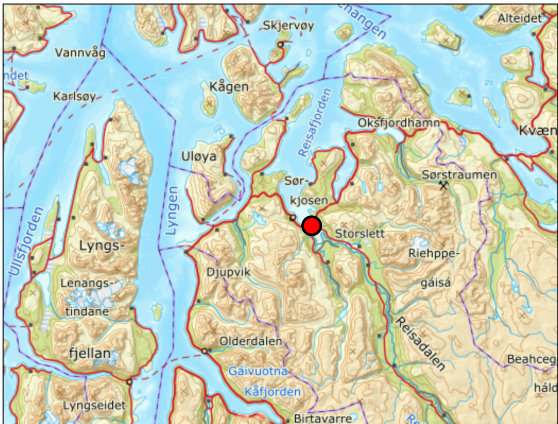
Figur 2.1. Regional plassering av planområdet vises med rød prikk.

Storslett sentrum ligger ved utløpet av Reisaelva til Reisa fjorden i Nordreisa kommune i Troms. Storslett er administrativt sentrum i Nordreisa, og er et tettsted med bebyggelse, næringsliv, skoler og annen infrastruktur. Storslett huser også Halti, nasjonalparksenteret for Reisa nasjonalpark, som er knyttet til Reisaelva, et nasjonalt laksevasdrag. E6 krysser i dag Reisaelva i Storslett sentrum like ovenfor der elva munner ut i Reisa fjorden via et elvedelta.